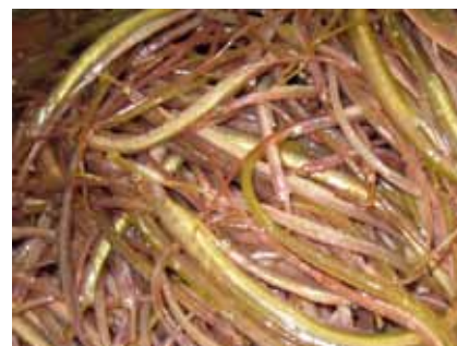
Mynd 2. Nøkur ár hevur heilt nógv av vaksnum sjópróni verið í yngultrolinum. Hesir eru frá einum háli í 2006.

Av og á kemur vaksin fiskur í yngultrolid. Talan er tá ofta um rognkelsi, knurrhana og vaksna nebbasild. Men okkurt árið hevur heilt nógv av sjópróni verið í, sí Mynd 2.