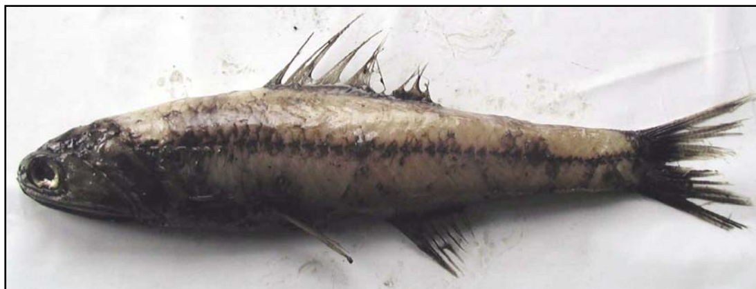
Mynd 2. Mjái prikkafiskur, eitt av teimum vanligastu prikkafiskasløgnum undir Føroyum.