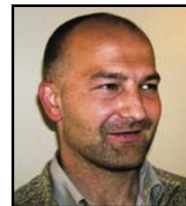
SÚNI LAMHAUGE LÍVFRØÐINGUR

Prikkafiskur svimur lítið og rekur tí mest aftur og fram við streyminum. Hann ferðast eisini lætt upp og niður í sjónum, tí hann er feitur fiskur og kann