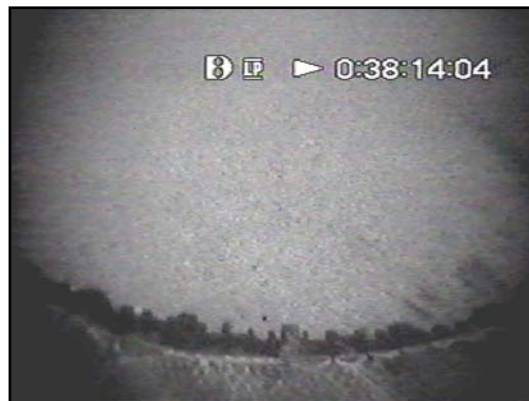
Mynd 2. Undirsjóvarupptøka, sum vísir niður á síðuna á umhvørvisvinnarliga grunninum (vinstrumegin) og niður á miðjuna á umhvørvisvinnarliga grunninum (høgrumegin).