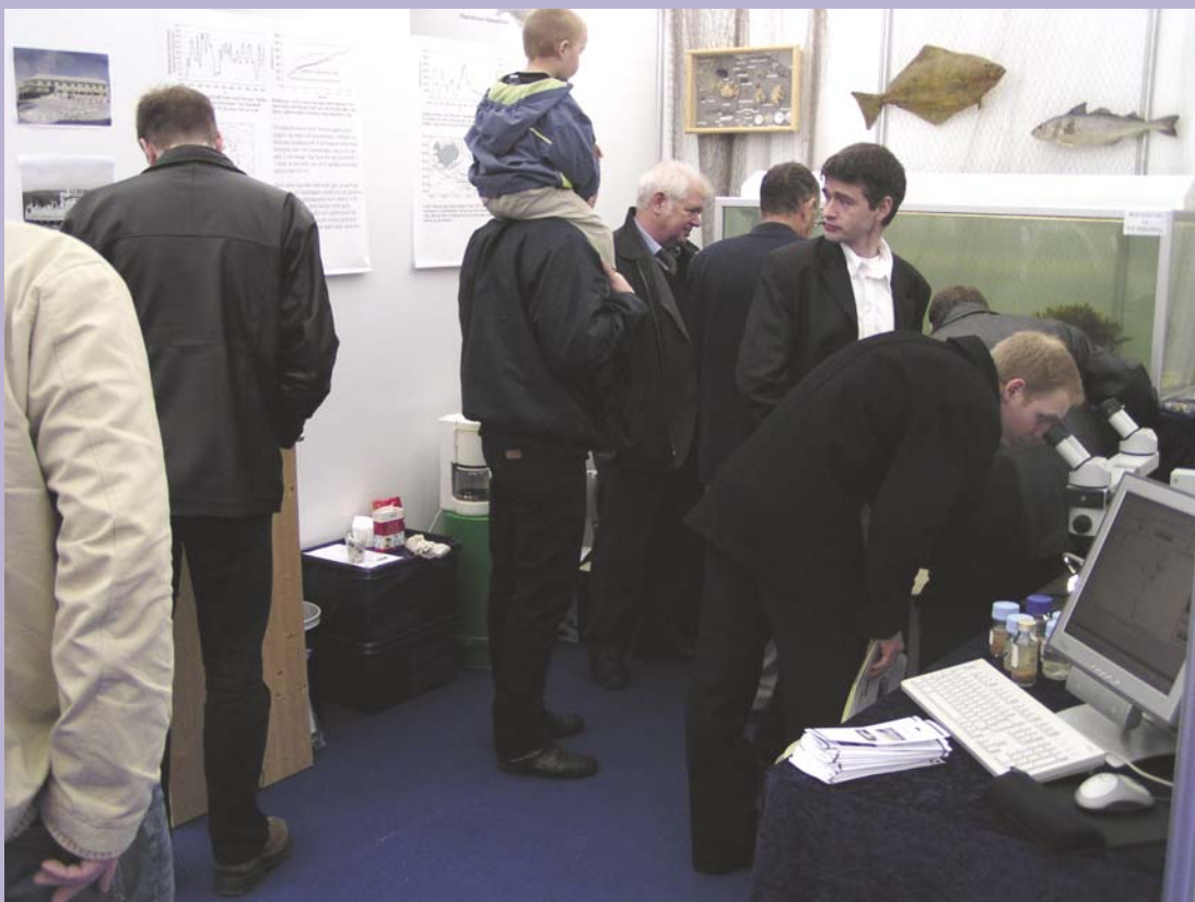
Mynd 1. Básurin hjá Fiskirannsóknarstovuni á Fish fair 2003.