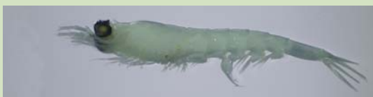
Mynd 1. Tey bæði høvuðssløgini av krill sunnan fyri Føroyar. Ovast: M. norvegica . Niðast: T. longicaudata .