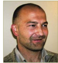
SÚNI LAMHAUGE LÍVFRØÐINGUR

Eisini er ein norðurlendsk verkætlan sett í verk, har øll vitan innan smáan uppsjóvarfisk verður savnað, framtíðar kanningarætlanir verða samskipaðar, og royndir við ymiskari útgerð skulu fremjast.