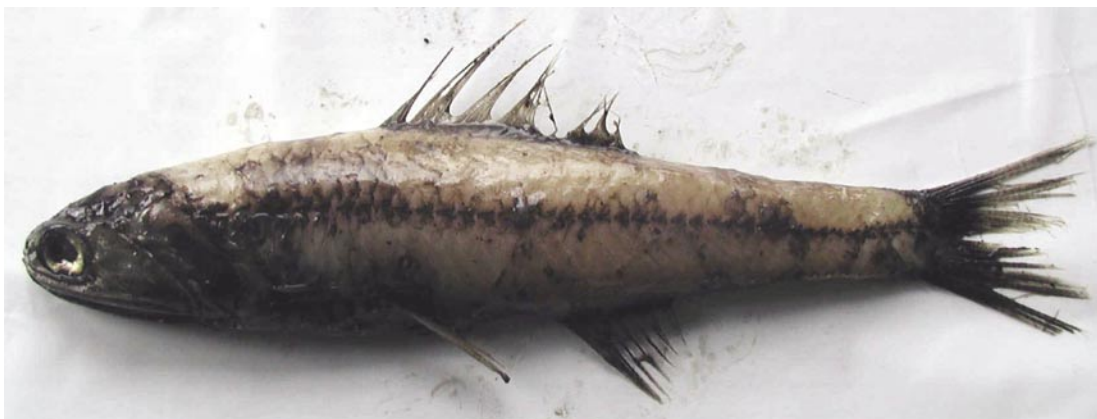
Mynd 1. Mjái prikkafiskur, ein tann vanligasti prikkafiskurin í føroyskum sjógvi.