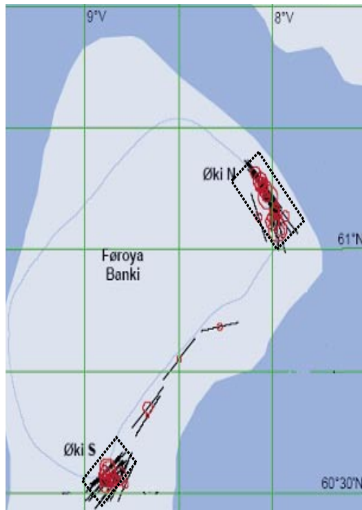
Mynd 2. Økini, har høggu-slokkur er at fáa við trolu.