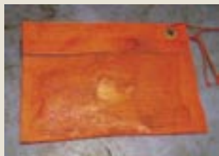
Mynd 1. Perforeraður agnposi omanfyri, og ávikavist ensk og kanadisk rúsa høgumegin.

Rúsumnar eru sera ymiskar í allar máttar, og tí var væntandi, at onnur av rúsunum royndist betur. Sum partur av gágguoyvinum bleiv Varðborg áløgd at føra dagbók yvir setur og