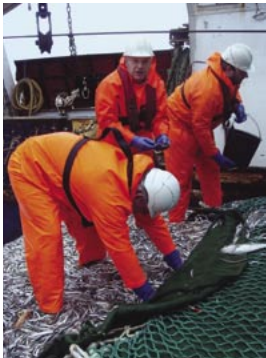
Onkur av manningini hevði sett sær fyri at finna eina met stóra nebbasild – tó uttan eydnu.

Samanumtikið kann tí einans staðfestast, at einki bendir á, at nebbasildastovnurin á Landgrunninum er týndur ella illa fyri. Hetta er sera gleðiligt – ikki minst fyri allar teir fiska- og havfuglastovnar, ið eru tengdir at honum.