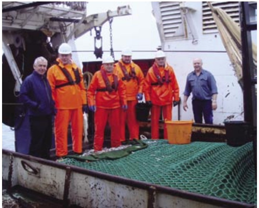
Ein røsk og vælnøgd manning framman fyri rokhálinum av nebbasild.