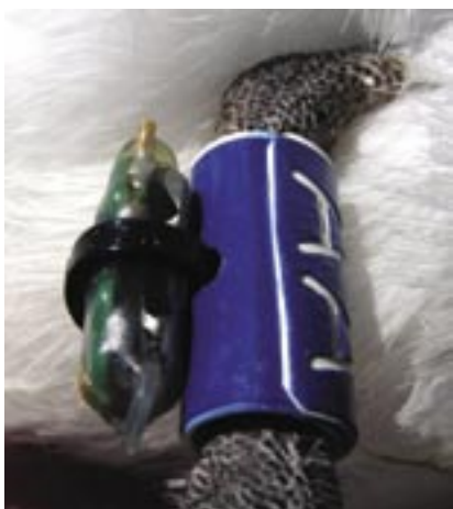
Geolocatorarnir vórðu settir á beinið við einum plastikkringi. Teir viga 1,8 g, og verða ikki mettir at darva fuglinum. Riturnar vóru tiknar meðan tær sótu á reiðrinum við ungum, og av tí at tær oftast koma aftur á sama stað at reiðrast á hvørjum ári, er góður møguleiki at fáa fatur á merkjunum komandi summer, so úrslitini kunnu avlesast.

tvær ferðir um dagin við einari óvissu úr 70 km upp í 300 km. Hetta kann tykjast sum ein stór óvissa, men tá ið hugsað verður um, at riturnar ferðast fleiri túsund km, so gevur hetta góð úrslit kortini. Tá ið so geolocatorarnir úr øllum ritubjörgunum verða viðgjørdir undir einum, fæst vónandi eitt gott innlit í, hvussu teir ymsu ritustovnarnir ferðast.