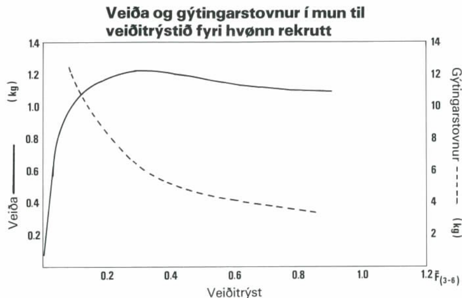
Mynd 10. Langtíðarúrtøka og gýtingarstovnur fyrri hvønn eitt ára gamlan tosk á landgrunninum.

tí ikki at brúka líka nógva orku at fiska eina tilsvarandi nøgd, sum vit í dag brúka nógva orku til. Hetta vil við øðrum orðum siga, at skilagóð stovnsrøkt gevur betri møguleikar fyrri meira lönandi fiskiskapi, enn tað er í dag.